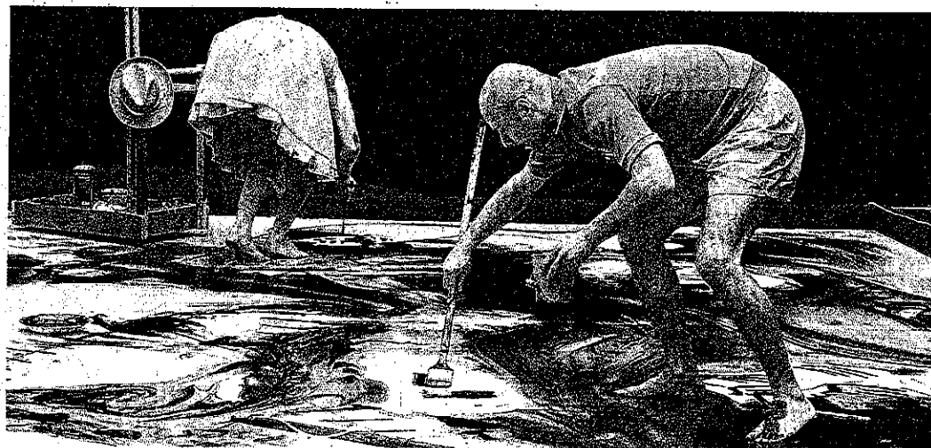
Die Darsteller gestalten während der Vorstellung den Bühnenboden.

Die als Roadmovie angelegte Geschichte in ihrem neuen Stück erzählt von drei jungen Menschen, die sich auf die Suche nach den Wurzeln ihrer Vorfahren machen. Dabei treffen sie auf unterschiedliche Biografien und werden immer wieder mit der Vergangenheit ihrer Angehörigen